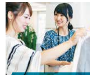
服飾・美容などのサービス業