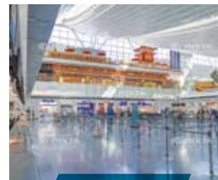
空港・ターミナル